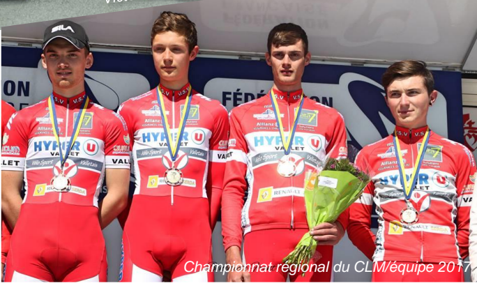
Championnat régional du CLM/équipe 2017