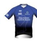
TEAM FÉMININ HAUTS-DE-FRANCE