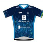
TEAM ELLES GROUPEMA PAYS DE LA LOIRE