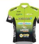
MADMANDE WOMEN DEVELOPPEMENT