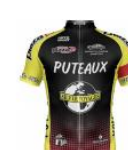
CSM PUTEAUX CYCLISME