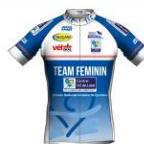
TEAM CENTRE VAL DE LOIRE FÉMININ