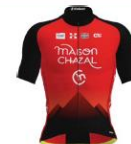
TEAM FÉMININ CHAMBERY