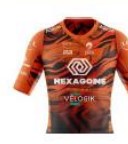
HEXAGONE - CORBAS LYON MÉTROPOLE