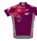
SPRINTEURS CLUB FÉMININ