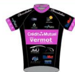
VELO CLUB MORTEAU MONTENOIT