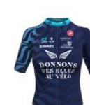
DONNONS DES ELLES AU VÉLO EVRY COURCOURONNES