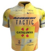
Massi Tactic Women's Team