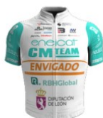
Eneicat RBH Global