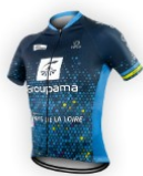
Team Elles Groupama - Pays de la Loire