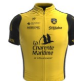
Stade Rochelais Charente Maritime