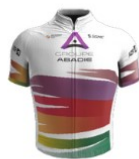
Team Groupe Abadie