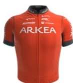
Arkéa Pro Cycling Team