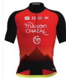
Team Féminin Chambéry