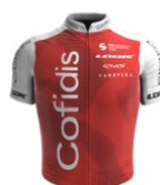
Cofidis Women Team