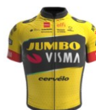
Team Jumbo Visma