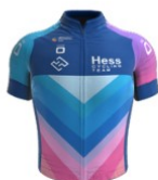
Hess Cycling Team