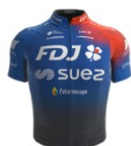
FDJ - Suez Futuroscope