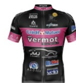
VC Morteau Montbenoit