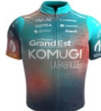
Team Grand Est Komugi - La Fabrique