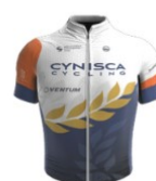
Cynisca Cycling Team