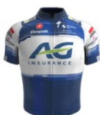
AG Insurance Soudal - Quick-Step