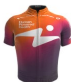
Human Powered Health