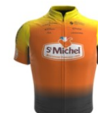
Saint Michel Mavic - Auber 93