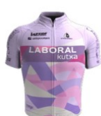
Laboral Kutxa Fundacion Euskadi