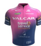
Valcar Travel & Service