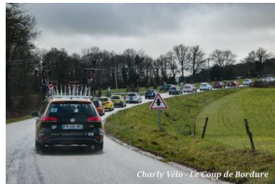
Charly Vêlo - Le Coup de Bordure