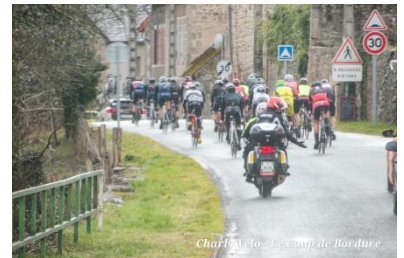
Charly Vêlo - Le Coup de Bordure