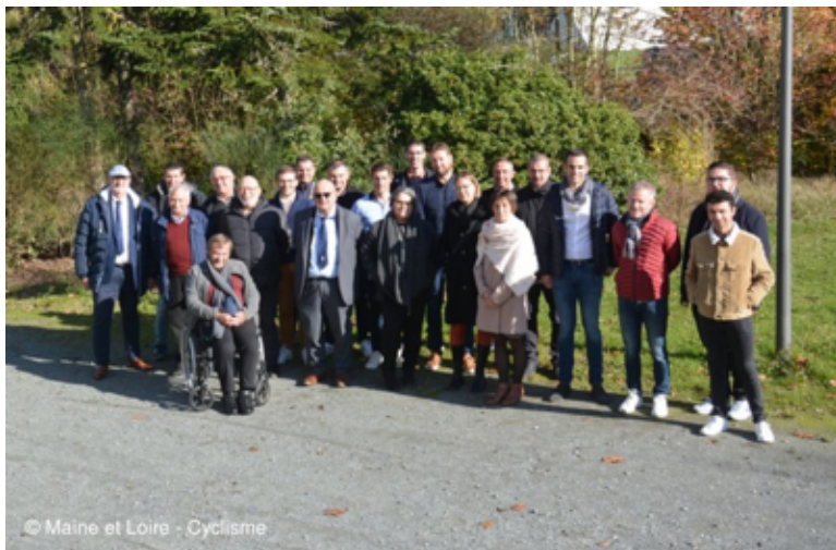
© Maine et Loire - Cyclisme

Comité départemental FFC du Maine et Loire