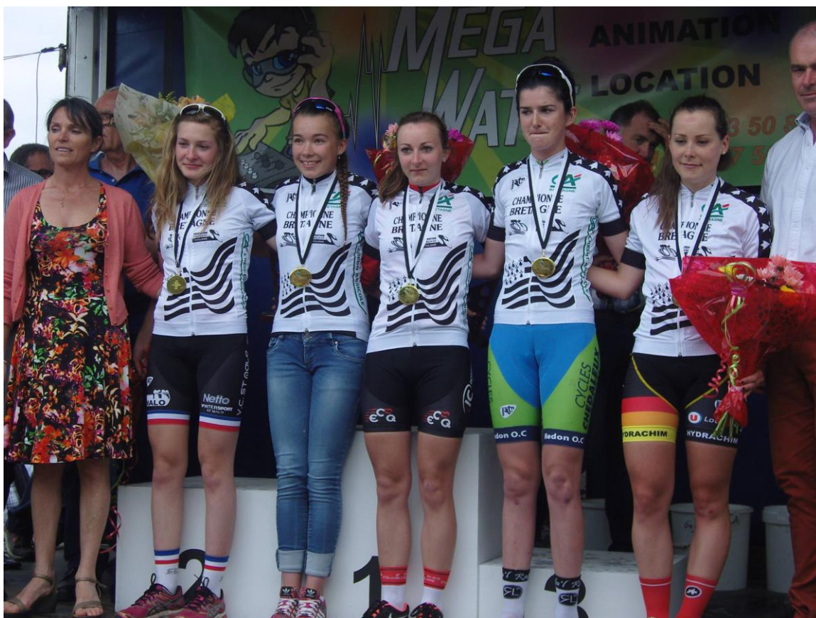
Les lauréates des championnats de Bretagne 2016

17h30 : Protocole et remise des maillots de championnes de Bretagne