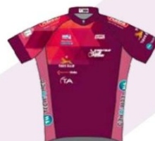
SPRINTEUR CLUB FÉMININ