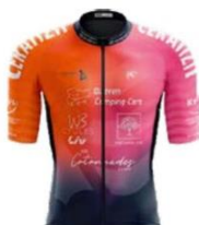
LANESTER WOMEN MORBIHAN