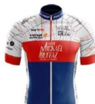
LYON SPRINT EVOLUTION