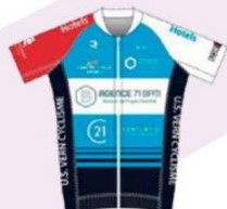
TEAM VERN 35 FÉMININ