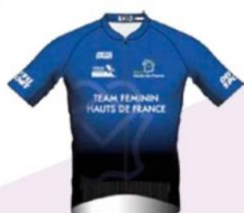
TEAM FÉMININ HAUTS-DE-FRANCE