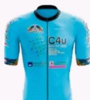
DES ROUES EN ELLES VC TURINOIS