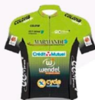
MARMANDE WOMEN DÉVELOPPEMENT