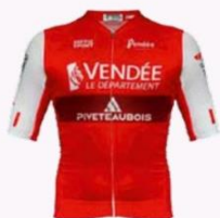
LADIES VENDÉE PIVETEAU BOIS