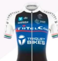
ENTENTE CYCLISTE THAONNAISE