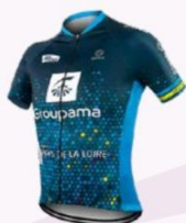
TEAM ELLES GROUPAMA PAYS DE LA LOIRE