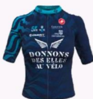
DONNONS DES ELLES AU VÉLO ÉVRY COURCOURONNES