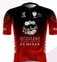
OCCITANE CYCLISME FORMATION FÉMININ