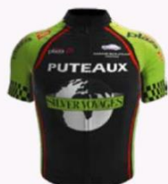
CSM PUTEAUX CYCLISME