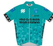
VC ISOIS TEAM STAMINA