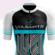
VC ELANCOURT ST-QUENTIN- EN-YVELINES TEAM VOUSSET