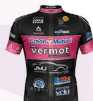
VC MORTEAU MONTBENOIT