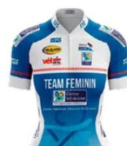
TEAM CENTRE VAL DE LOIRE FÉMININ