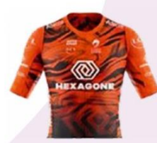
HEXAGONE - CORBAS LYON MÉTROPOLE