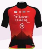
TEAM FÉMININ CHAMBÉRY